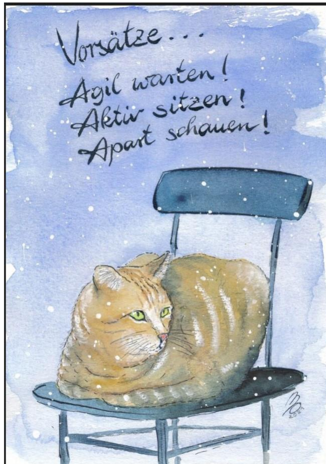
Abbildung 1 https://matthias-ose.de/portfolio/vorsaetze-karikatur-fraenkische-zeitung-9-1-2021/