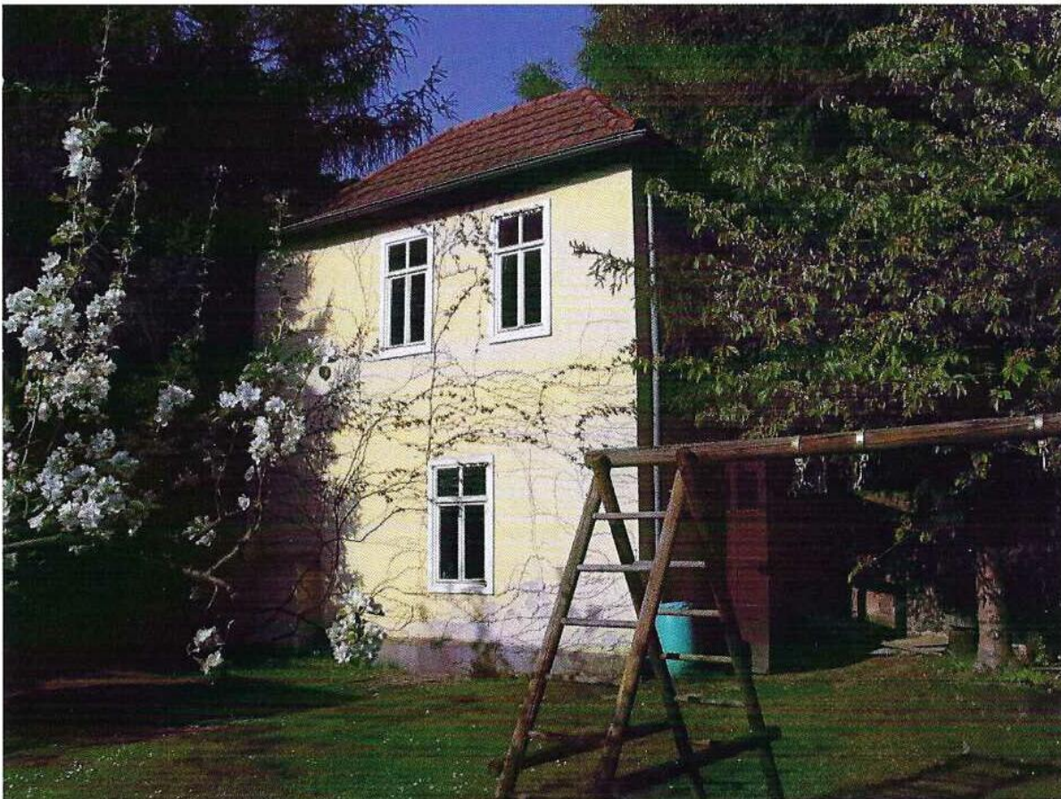
Das Teehaus der Englischen Fräulein (Maria-Ward-Schwestern) im alten Fuldaer Holzgarten in der Buseckstraße Foto: Michael Mott In: Wo die „Englischen Fräulein“ mit ihren Schülerinnen Tee tranken. Fuldaer Geschichtsblätter 98/2022. Fulda 2023. S. 133-144.