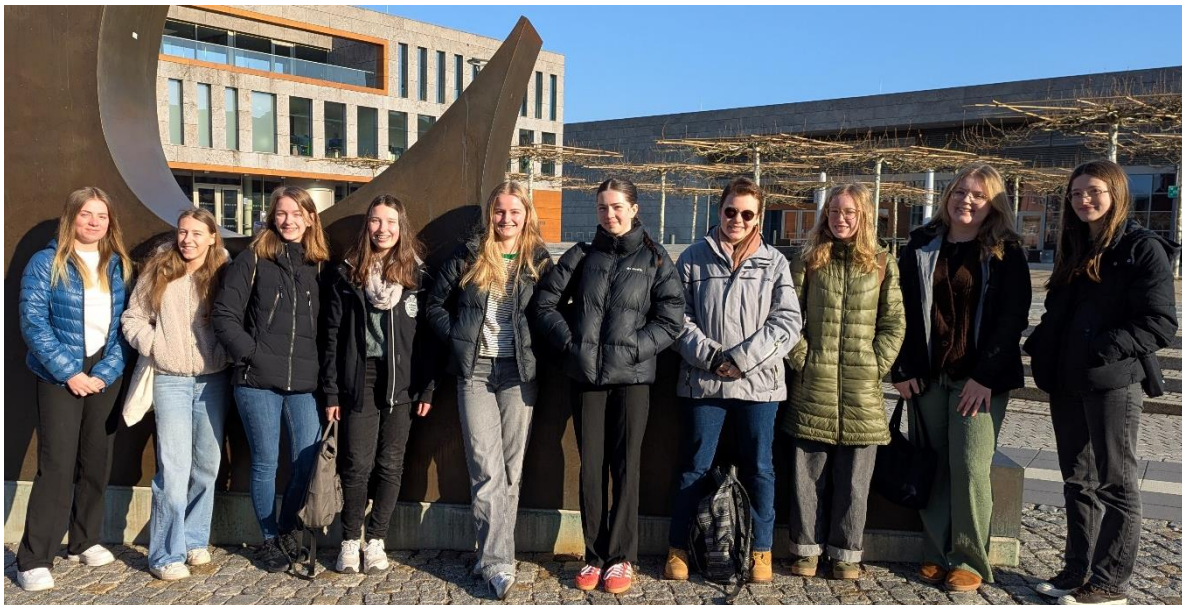
Teilnehmerinnen am Tag der Mathematik an der Hochschule Fulda

Zu Beginn des Wettbewerbs knobelten die Mathe-Cracks von Schulen aus Fulda, Hünfeld und Bad Hersfeld zunächst in 16 Teams an ihren teils sehr schwierigen Aufgaben. Danach folgte ein Einzelwettbewerb, bei dem die drei Bestplatzierten je eine Modellierungswoche im Wert von 600 € gewannen, gesponsert von der Ewald-Vollmer-Stiftung. Nach einem Imbiss traf man sich wieder im Team um „Mathematische Hürden“ möglichst schnell zu meistern. Alle wirkten angestrengt, jedoch zufrieden mit ihrer Bearbeitung und der Erfahrung, durch gemeinsame Anstrengung und gute Ideen unbekannte mathematische Probleme lösen zu können.