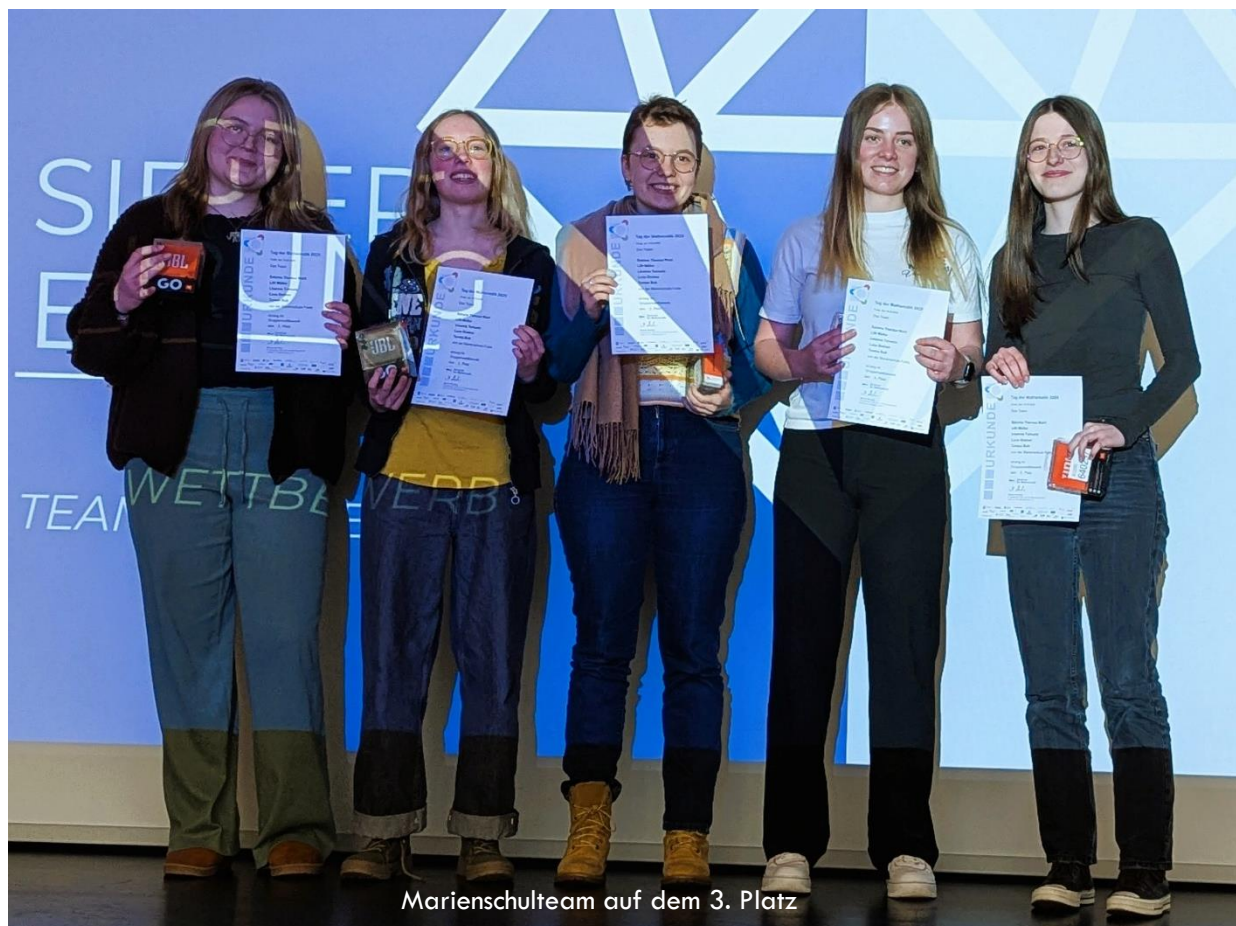
Marienschulteam auf dem 3. Platz

Marienschülerinnen auf hervorragendem 3. Platz