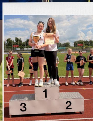
BESTE KLASSE: 9B